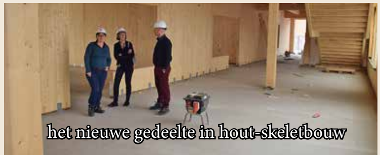
het nieuwe gedeelte in hout-skeletbouw

De leerlingen zitten nu tijdelijk in een bedrijfspand, wat eerder aan een transportbedrijf toebehoorde.