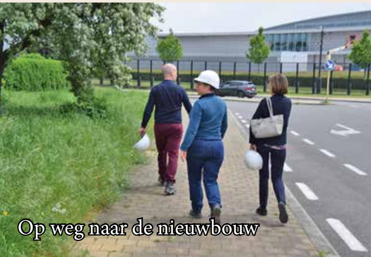
Op weg naar de nieuwbouw

De school in Haren is de op één na nieuwste van de 11 Scholen met de Bijbel in België. Momenteel is er een flinke verbouwing aan de gang, waarbij het oude gebouw wordt uitgebreid met een nieuw gedeelte in CLT_-skeletbouw, (een heel nieuwe duurzame techniek). Het gebouw zal straks aan alle voorwaarden van een moderne school voldoen.