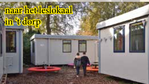
naar het leslokaal in 't dorp