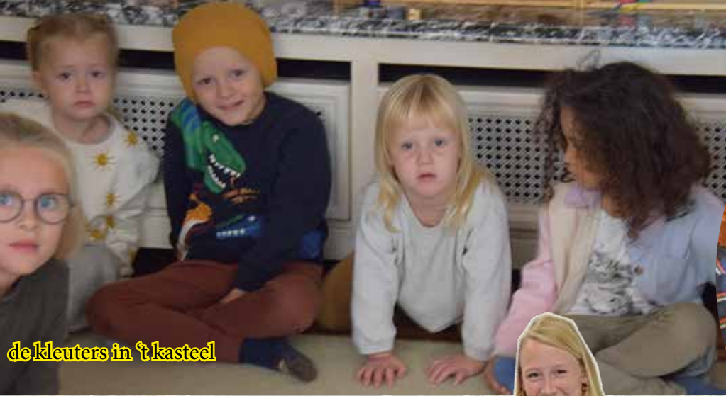
de kleuters in 't kasteel