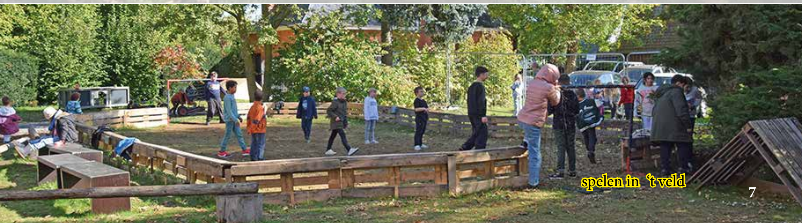
spelen in 't veld