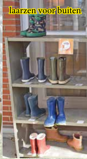
laarzen voor buiten