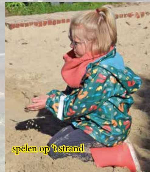
spelen op 't strand