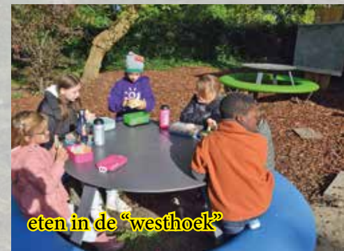
eten in de "westhoek"