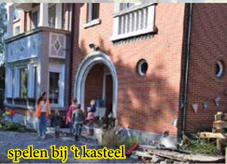
spelen bij 't kasteel