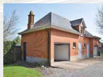
De kleuters komen in de garage/paardenstal.