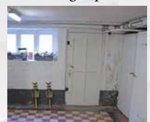
In de kelder komen toiletgroepen.