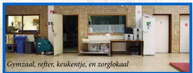
Gymzaal, refter, keukentje, en zorglokaal

Doordat er op de tweede verdieping een stuk bij komt, kunnen het eerste t/m het zesde leerjaar naar de bovenverdieping en de kleuters kunnen dan met drie klassen beneden blijven, evenals de gymzaal en de refter. Nu wordt de gymzaal iedere keer nog omgebouwd tot eetplaats voor alle leerlingen, maar dat zal na de verbouwing niet meer nodig zijn. Op deze school krijgen de leerlingen tussen de middag een warme maaltijd via een cateringbedrijf.