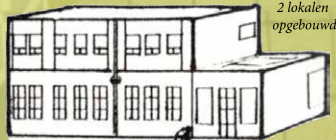
hier worden 2 lokalen opgebouwd