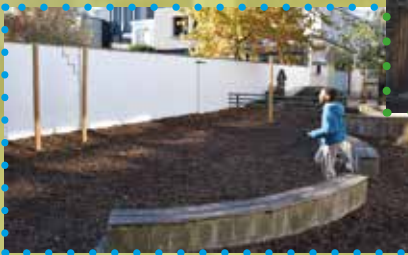
De speelplaats is al voor een deel onverhard.