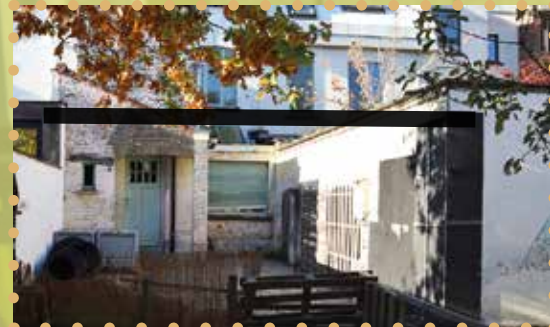
Het woonhuis met de groene deur en rolluik wordt verkocht. De zwarte lijn laat zien hoe de bestaande muur wordt doorgetrokken.